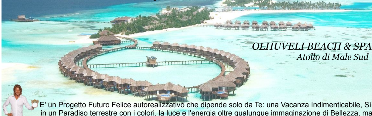
OLHUVELI BEACH & SPA Atollo di Male Sud

Vuoi regalarti una esperienza indimenticabile, Vivere e trarre Ispirazione dalla più intensa Bellezza di un Paradiso Terrestre, per farlo tuo, e portarlo poi in Te, ovunque tornerai e andrai ?